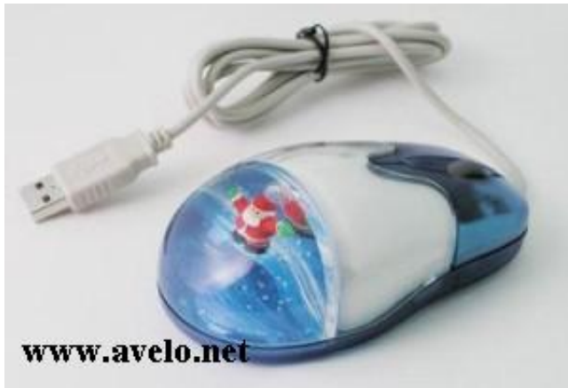
La boule sapin de noel