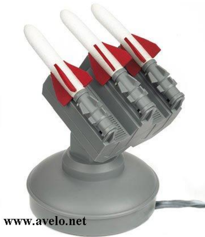
Le brumisateuseur usb .